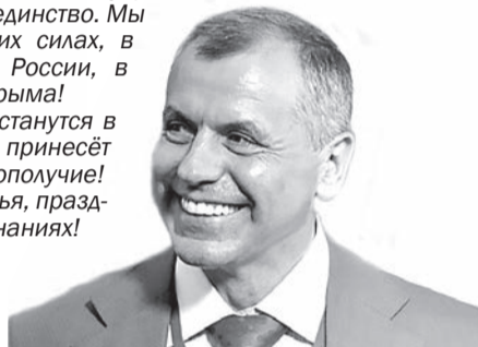
Председатель Государственного Совета Республики Крым Владимир Константинов

Желаю вам и вашим близким крепкого здоровья, праздничного настроения, удачи во всех делах и начинаниях!