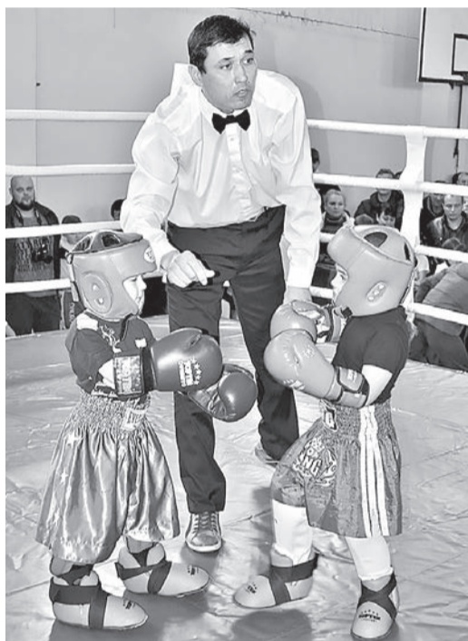
Первенство по восточным единоборствам