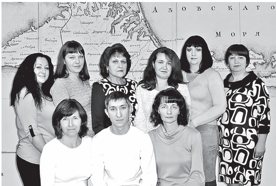
Коллектив отдела №13 Управления Федерального Казначейства по Республике Крым

25 лет – это знаменательная дата для казначейской системы. Казначейство является надёжной и передовой системой, обеспечивающей сохранность финансовых средств России. Сотрудники казначейства являются его неотъемлемой частью. Это коллектив профессионалов, единомышленников, стремящихся к совершенству. Главная задача для работников – трудиться максимально-эффективно, расценивать интересы Государства, как свои личные и не останавливаться на достигнутом. Нас всех объединяет одно: любовь к своей работе, к своему делу. Можно иметь самую передовую технику и самые прогрессивные технологии, но без верности и преданности своему делу невозможно добиться высоких результатов.