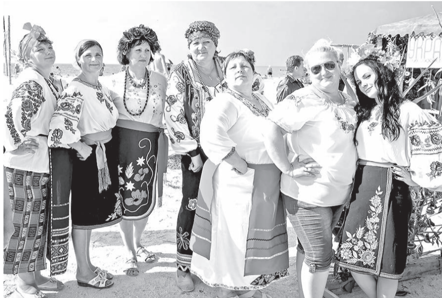
С коллегами на фестивале «Прибой собирает друзей»