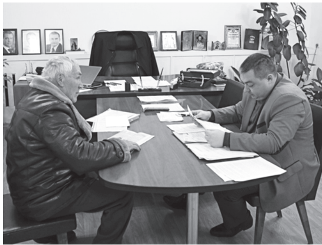
заместителю главы Администрации – Главному архитектору района и заведующему архивным сектором оказать