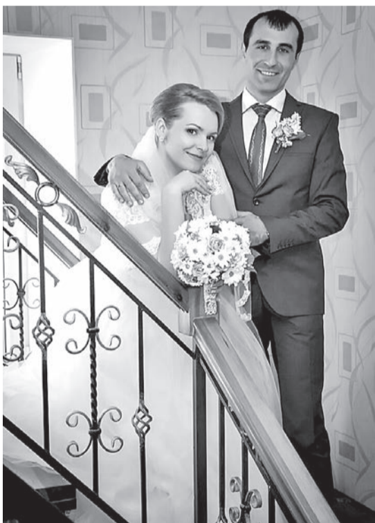
С женой Алесей

Подытоживая статью, хочется сказать: побольше бы таких людей, которые с самоотдачей служат своему делу и вносят огромный вклад в воспитание подрастающего поколения, прививают любовь к здоровому образу жизни, служат примером и детям, и взрослым. Так держать, тренер!