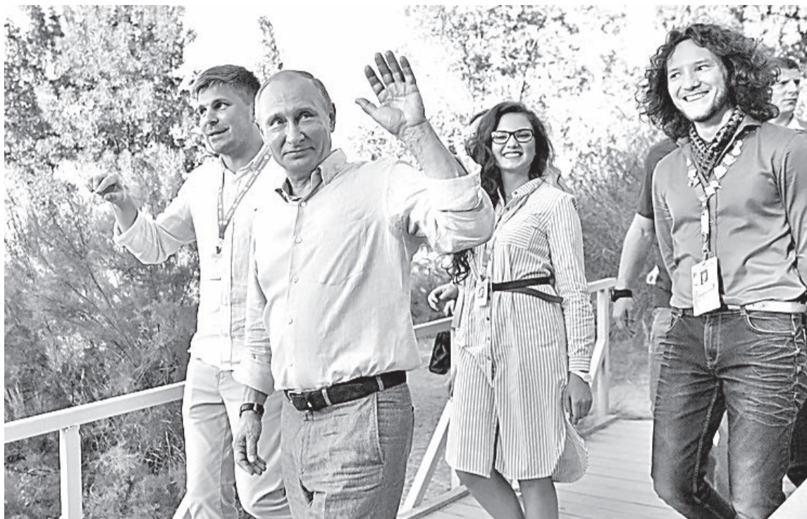
Директор Всероссийского молодежного образовательного форума «Таврида» Сергей Першин и президент России Владимир Путин на Бакальской косе

Он также поддержал идею президентских грантов в сфере режиссуры кино и театра. «Я знаю, что Минкульт поднимал уже