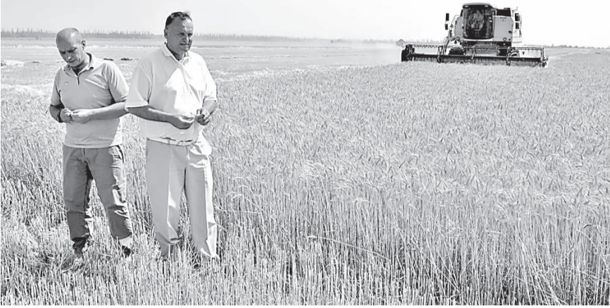
По материалам отдела по вопросам развития сельского хозяйства подготовила Виктория СЕРГЕЕВА

В разгар уборочной страды представители властей Раздольненского района провели встречи с руководством двух крупнейших сельхозпредприятий района - ООО «Чернышевское» и КФХ «Хлебороб». Встречи проходили совместно со специалистами отдела сельского хозяйства Администрации Раздольненского района, обсуждались вопросы, связанные с уборкой ранних зерновых культур урожая нынешнего года.