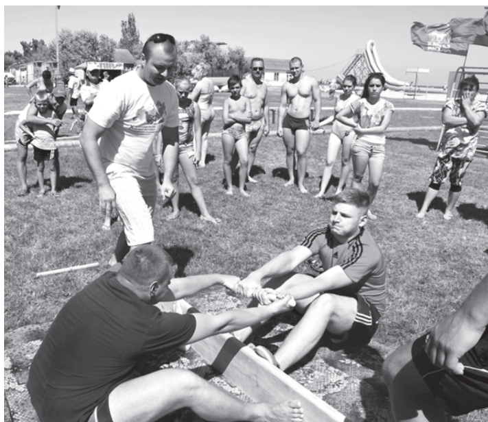
Общий зачет: Инфокар - 1, с.Аврора - 2, с.Черныше-