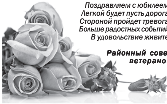
Районный совет ветеранов

Вы с годами стали краше, Наше солнце, радость наша! Комплиментов не жалея, Поздравляем с юбилеем! Легкой будет пусть дорога, Стороной пройдет тревога. Больше радостных событий, В удовольствие живите!