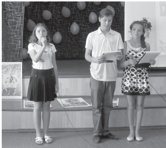
Отдел образования, молодежи и спорта

Ребята и приглашенные гости смогли принять участие в интерактивной литературной викторине и получили массу положительных впечатлений.