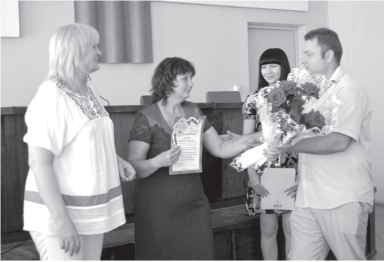
В Большом зале Администрации прозвучали поздравления в честь Дня работника социальной сферы.