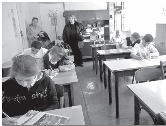
Дети отвечают на вопросы по ПДД

По итогам всех этапов победителем конкурса стала команда