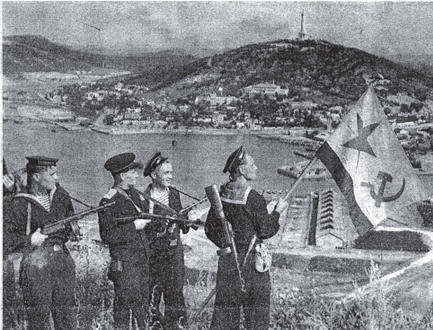
Советские моряки в Порт-Артуре